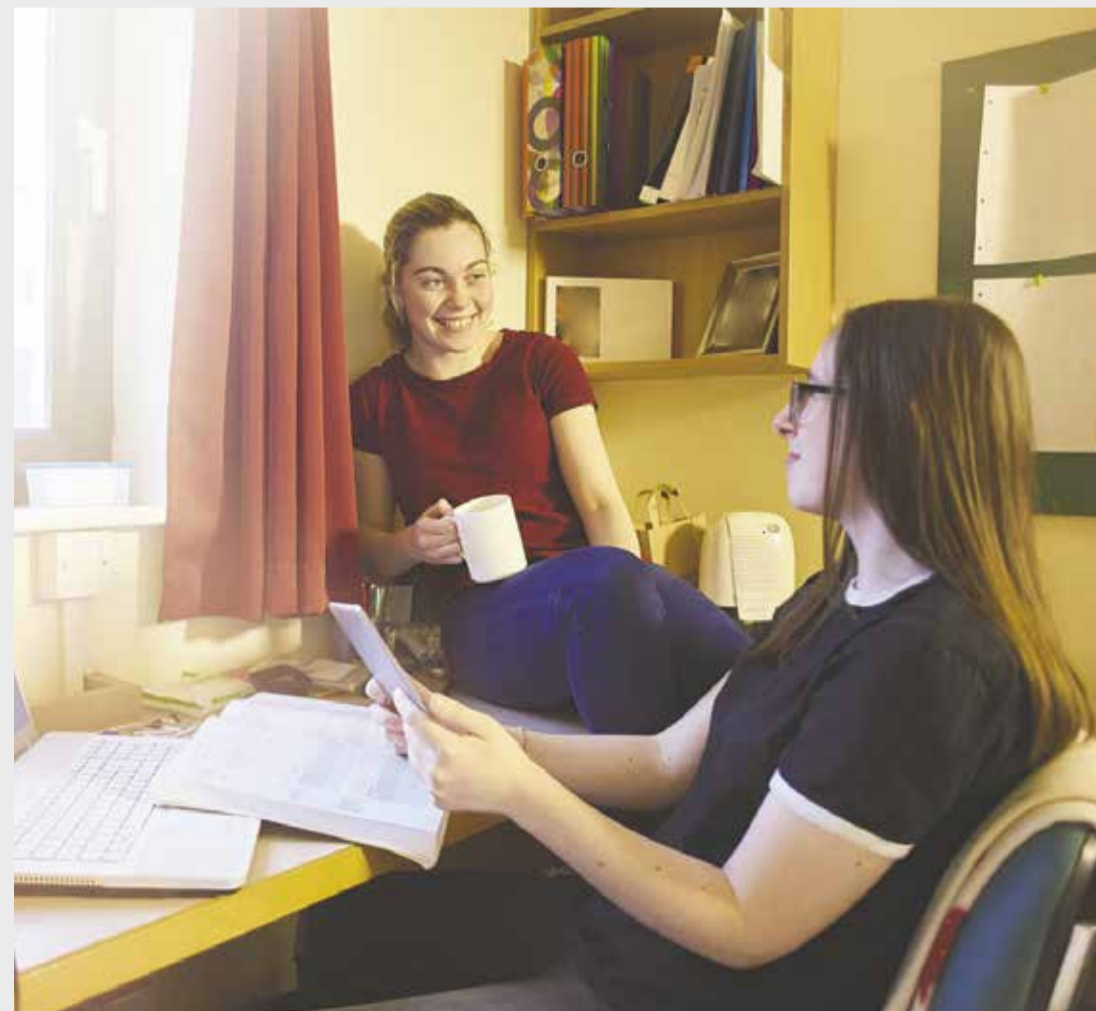
På skolehjemmet får du nye venner.

Et skolehjem er lige præcis dét – et sted hvor du kan føle dig hjemme, mens du går i skole.