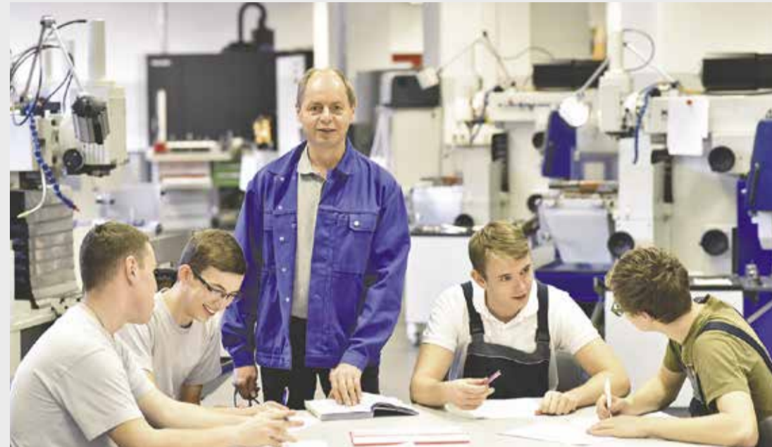
På skolen lærer du de ting, som du skal bruge, når du er ude i virksomheden.

På nogle uddannelser vil du kunne tage dine skoleophold her på Bornholm, og på andre uddannelser vil skoleopholdene foregå på andre erhvervsskoler i Danmark.