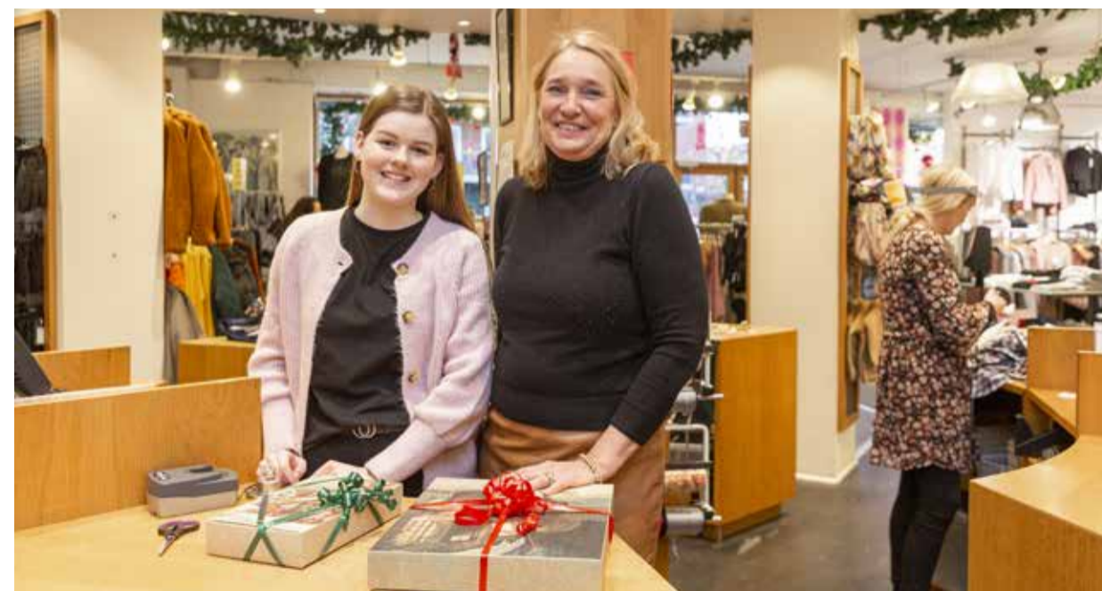
Hos Simon's har de den indstilling, at hvis du ikke kan det, så kan du lære det.