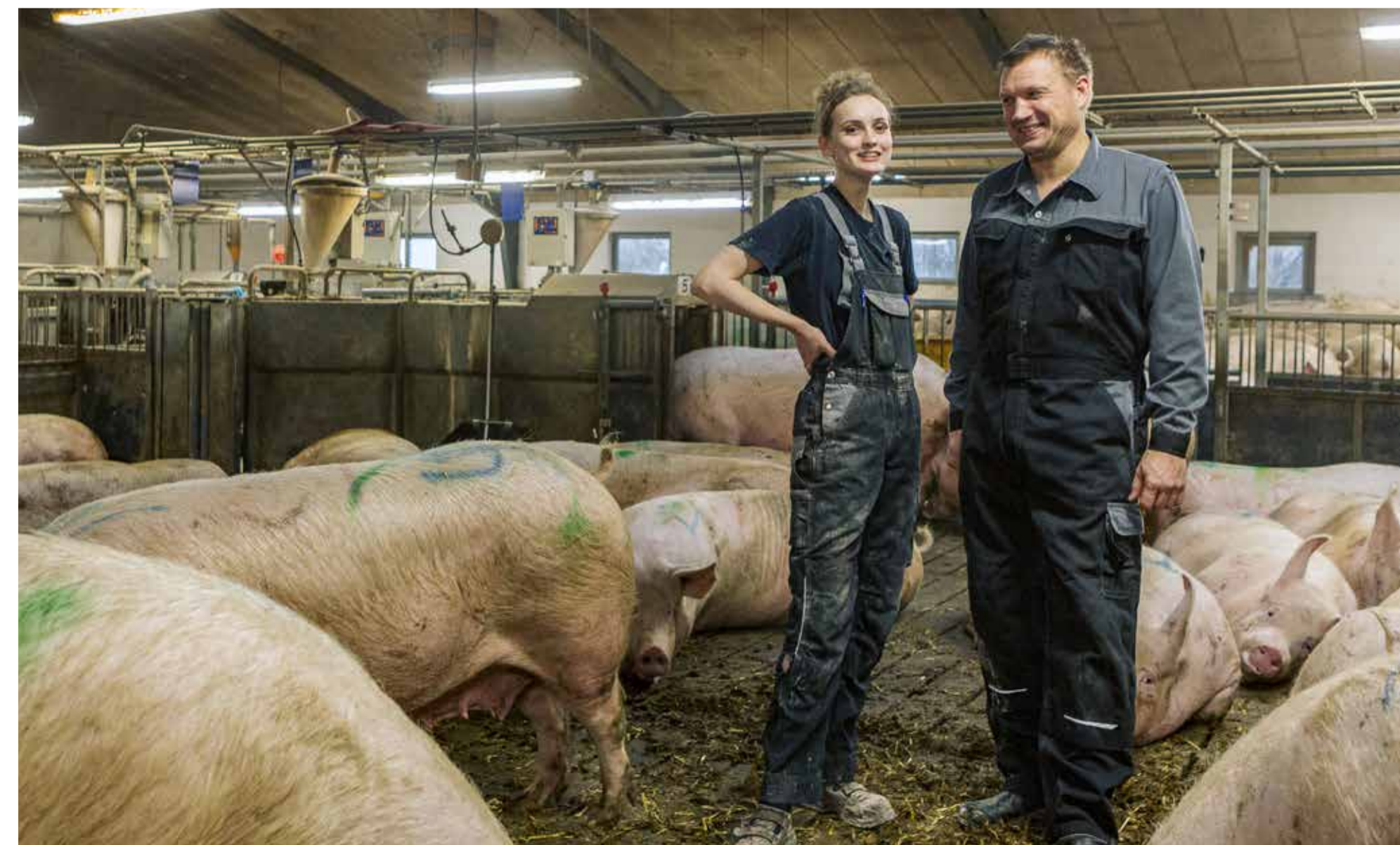
På Ellesgaard er eleverne en vigtig del af virksomheden.

Siden 2009 har Ellesgaard haft ca. 20 elever. Alle har fuldført uddannelsen. Eleverne på Ellesgaard studerer typisk Landmand og Husdyr eller Landmand og Planter.