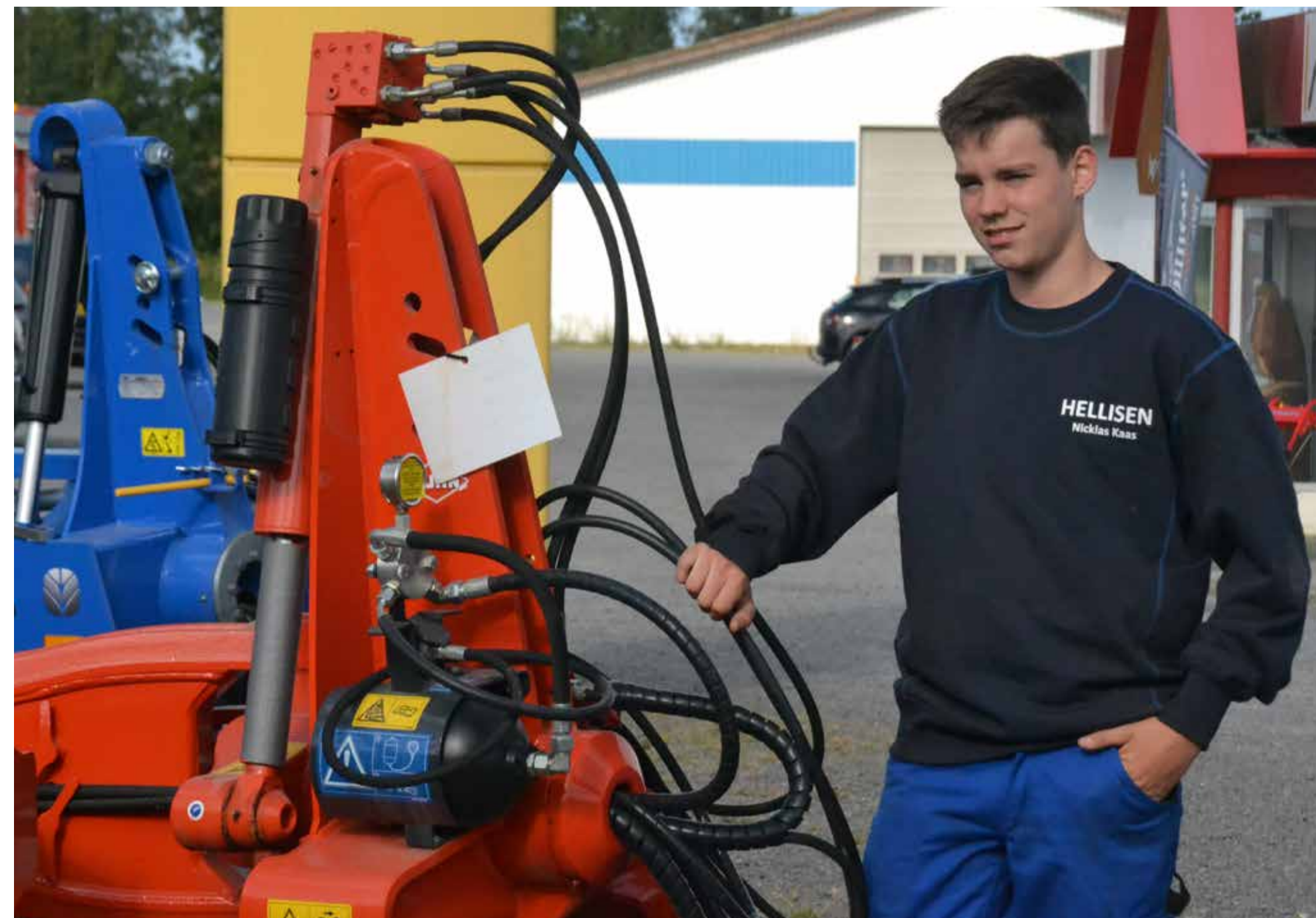
Når du har en elevaftale med en virksomhed, så kan du få elevløn, mens du uddanner dig.