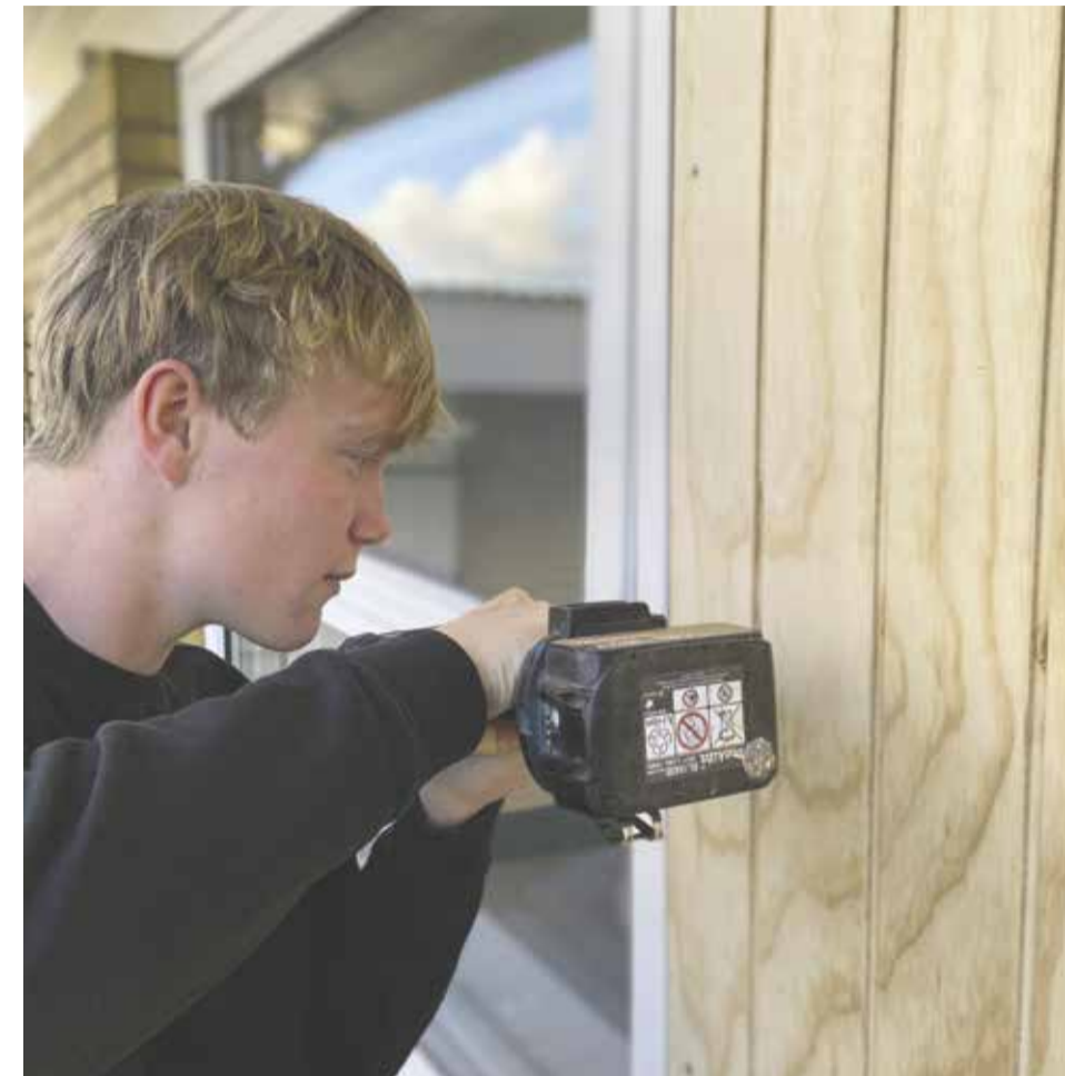
For Jonatan er det praktiske arbejde noget af det bedste ved uddannelsen.