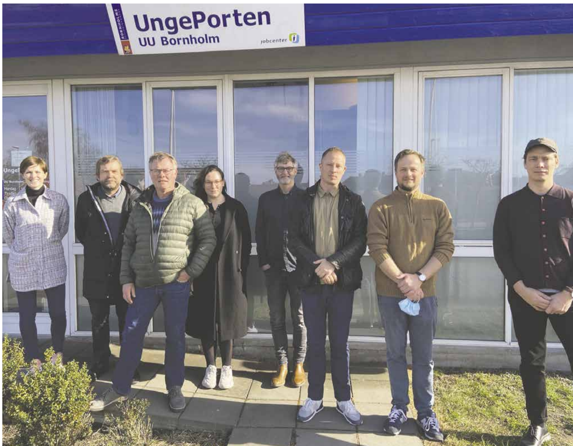
Hos UU-vejledningen vejledes unge af erfarne rådgivere om valg af ungdomsuddannelse eller andre aktiviteter, der kan flytte den unge tættere på job eller uddannelse.