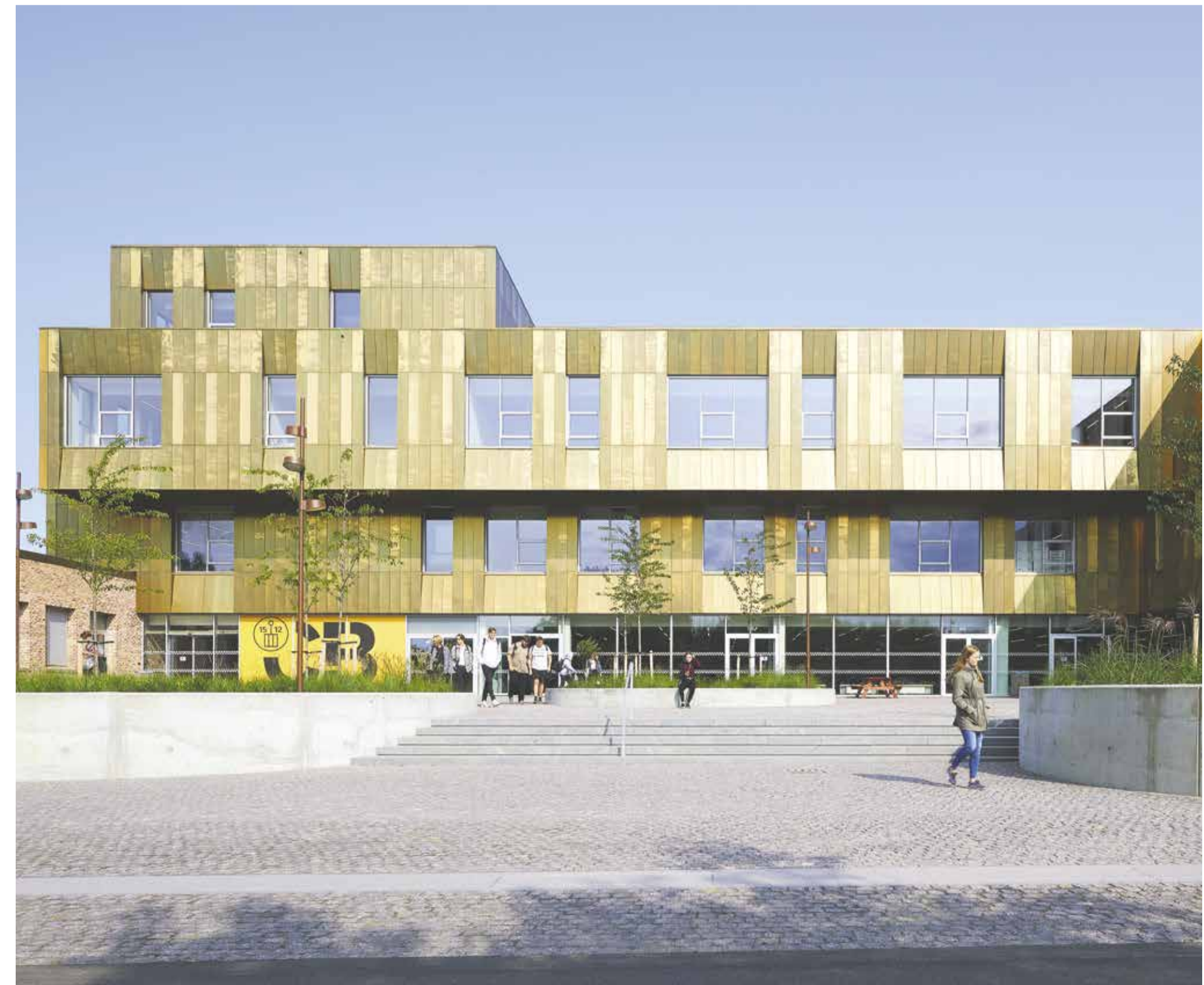
Det nye flotte Campus Bornholm i Rønne.